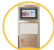
7寸真彩触摸屏 白板设计透明插页框