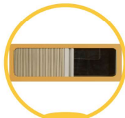
自由拉伸内嵌布制遮光帘(选配)