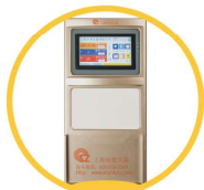
7寸真彩触摸屏 白板设计透明插页框